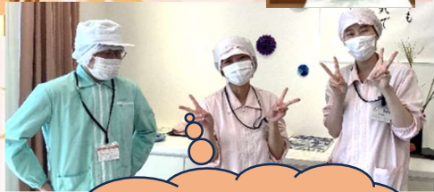
ナリコマさんの出張料理